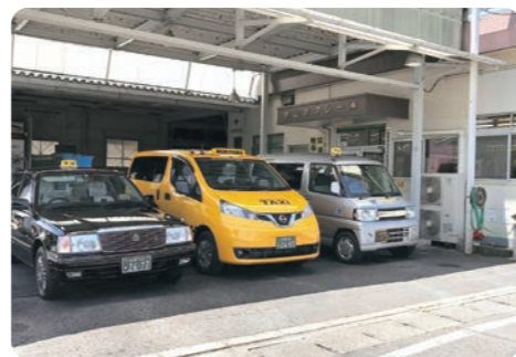
編集 守山市民新聞